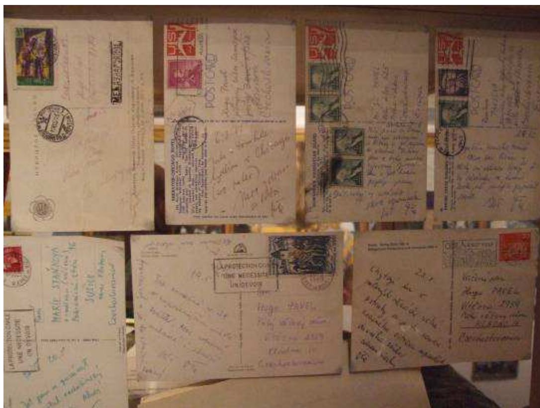
Z korespondence O. Pavla