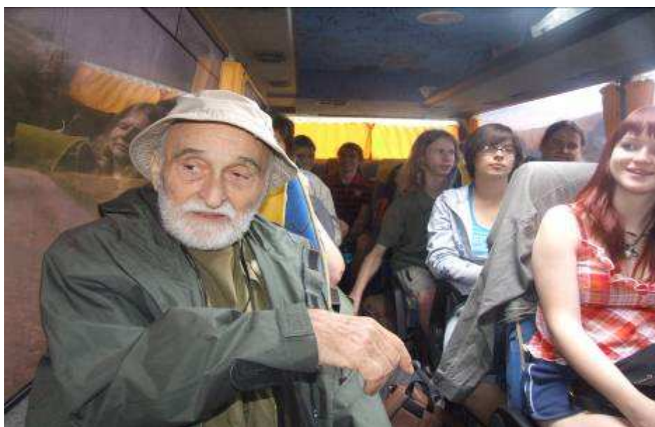
Nálada v autobuse