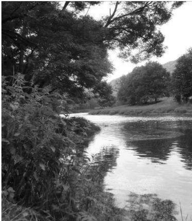
Pohled na Berounku