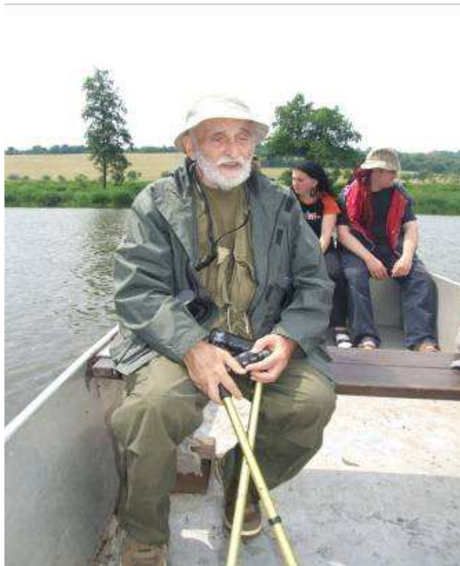
Přívoz na Berounce