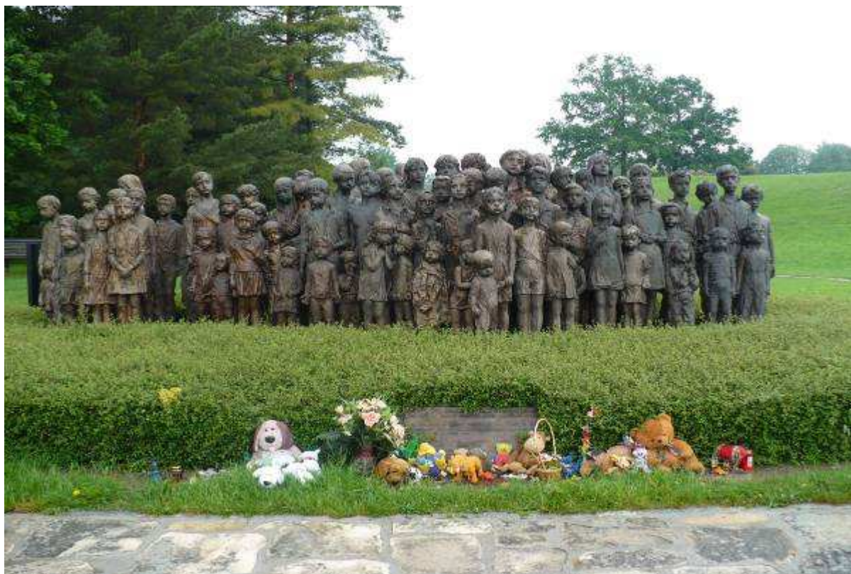
Památník dětským obětem masakru v Lidicích

Naše pouť pokračovala do Lidic, živoucího důkazu hrůz nacistické okupace a dále do Lán místa spjatého s životem „prezidenta osvoboditele“ T. G. Masaryka. Tím putování krajem Oty Pavla skončilo.