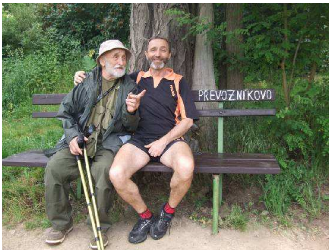
Převozník v roce 2008