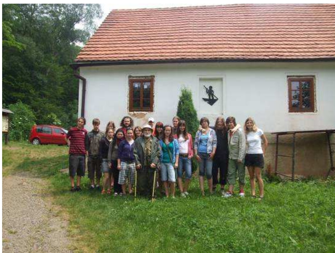
Před pamětní síní Oty Pavla