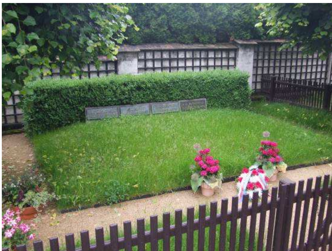
Hrob T. G. Masaryka a jeho rodiny