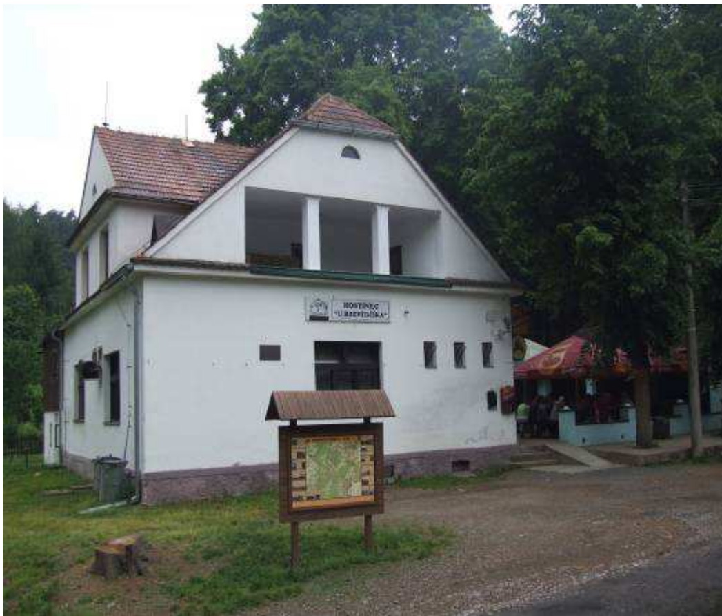
Hostinec U ROZVEDČÍKA