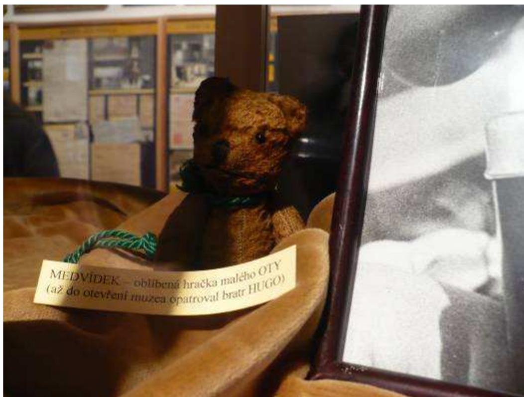
Vzpomínka na dětství